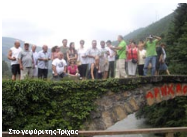
Στο γεφύρι της Τρίχας

μέρη που θα επισκεφθούμε, ενώ κάποιοι θα απολαύσουν ένα καφέ ή το παραδοσιακό ποτό των Τούρκων, το τσάι στο γραφικό λιμάνι, έχοντας στο μυαλό μας ότι εδώ αναδειχθηκαν οι βασικές ιδέες της ελευθερίας.