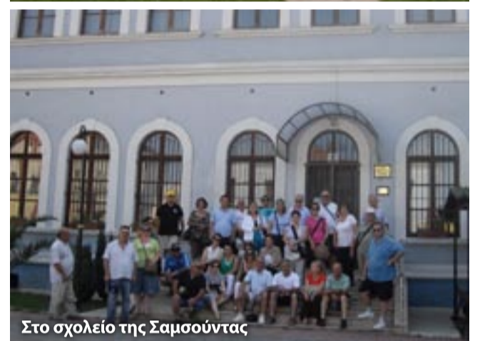
Στο σχολείο της Σαμσουντας