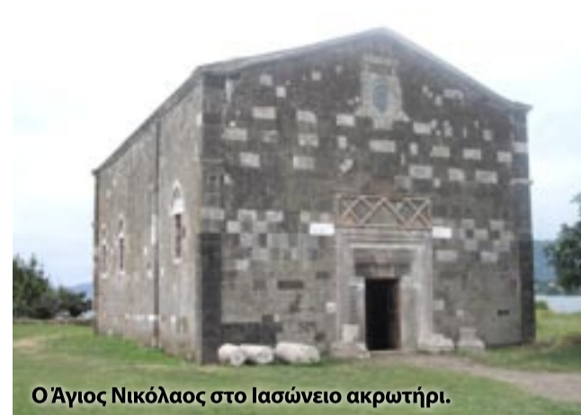
Ο Άγιος Νικόλαος στο Ιασώνειο ακρωτήριο.