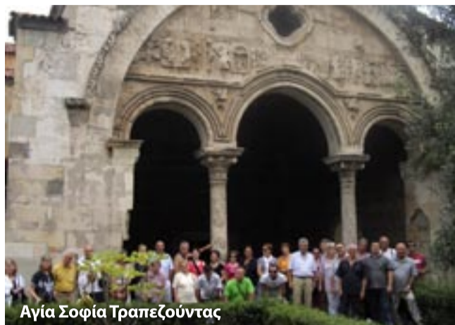
Αγία Σοφία Τραπεζούντας