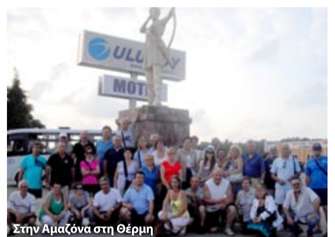
Στην Αμαζόνα στη Θέρμη