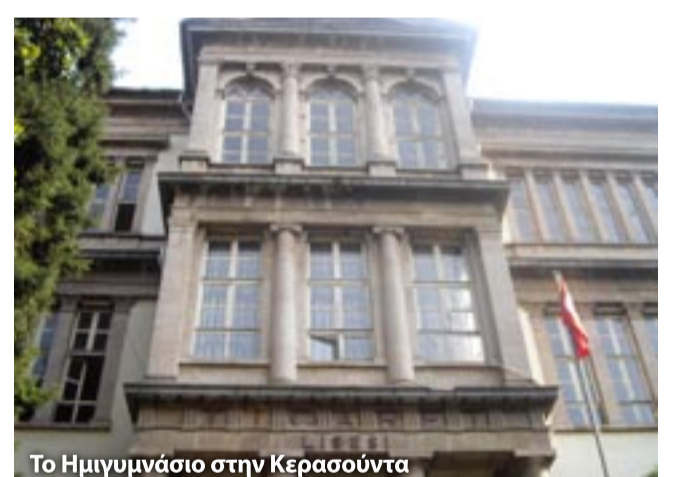
Το Γυμνάσιο στην Κερασούντα

Η πόλη του Διογένη του Σινωπέα, του Απόστολου Ανδρέα και πολλών άλλων αγίων όπως του Αγίου Φωκά του κηπουρού, η πρώτη αποικία των Μιλησίων, βρίσκεται σε οικοδομικό οργανισμό, είναι πλέον μια κοσμοπολίτικη πόλη και ο πληθυσμός της το καλοκαίρι φθάνει τις 200.000 κατοίκους. Οι παλιές φυλακές της πόλης είναι ξακουστές, το ελληνικό κάστρο, το Αρρεναγωγείο, το Παρθεναγωγείο και το μουσείο θα είναι τα