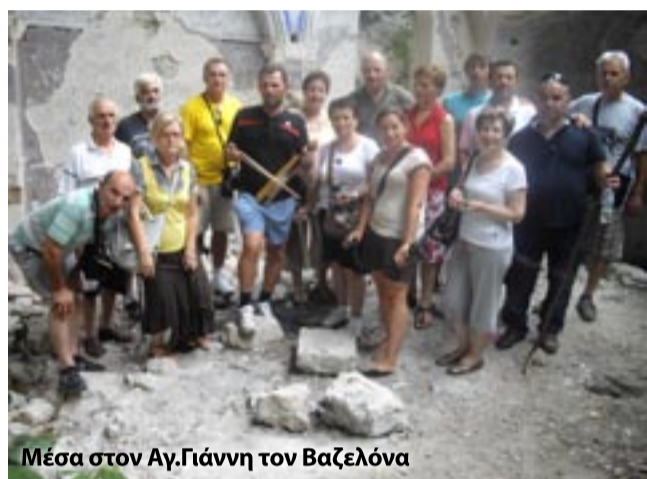
Μέσα στον Αγ.Γιάννη τον Βαζελόνα