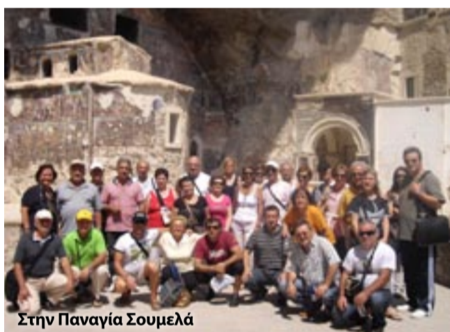
Στην Παναγία Σουμελά