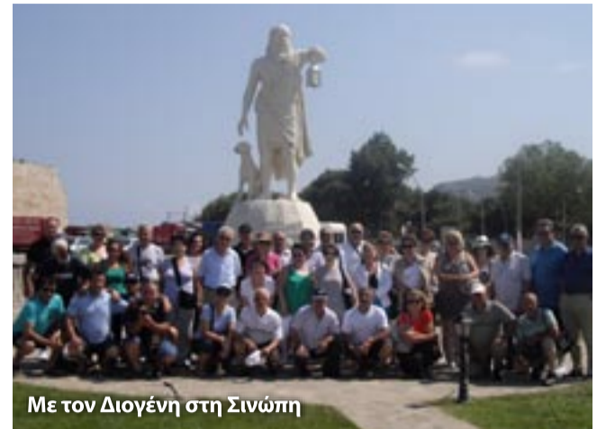
Με τον Διογένη στη Σινώπη

Το πρωινό είναι αρκετά καλό και γύρω στις 08:30 ξεκινάμε την πορεία μας για τη Σινώπη. Μετά από τρεις ώρες πορείας μέσα στις πράσινες πλαγιές του όρους Ιλγκάς Ντάγ όπου συναντάμε την πόλη Πομπηούπολη, αρκετά χωριά, ποτάμια και τον Αμινό ποταμό θα φθάσουμε στην Σινώπη. Λίγο πριν φθάσουμε στη Σινώπη θα δούμε μπροστά μας τον Εύξεινο Πόντο κατεβαίνοντας από τα υψώματα του βουνού.