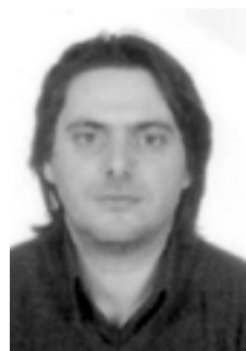
Γράφει ο Γιώργος Κασαμπαλίδης

Η λαογραφία στη χώρα μας γεννήθηκε από την ανάγκη να υποδείξει το ελληνικό κράτος τη συνέχεια με την αρχαία Ελλάδα, καθώς και να αντικρούσει τις θεωρίες του Φαλμεράιερ, θεωρίες που σαφέστατα δεν αγγίζουν εμάς τους Πόντιους. Συμπληρώθηκαν 100 χρόνια από την ίδρυση της Ελληνικής λαογραφικής εταιρίας.