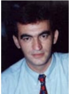
Επιμέλεια: Χωραφαΐδης Αβραάμ

Η άλωση της Κων/πολης (1453) έγινε αιτία πολλοί Έλληνες να βρουν (προσωρινό) καταφύγιο στην Τραπεζούντα. Η πόλη, παρ' ότι απόμακρο κέντρο του εμπορίου της Ανατολής, ήταν μια άλλη μικρή Κωνσταντινούπολη, ιδιαίτερα μετά την πτώση της πρωτεύουσας του βυζαντινού κράτους, αποτελώντας τη μόνη ανεξάρτητη και νόμιμη πολιτική αρχή του ελληνικού έθνους.