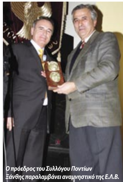
Ο πρόεδρος του Συλλόγου Ποντίων Ξάνθης παραλαμβάνει αναμνηστικό της Ε.Λ.Β.

Όμως πρέπει να τονίσω, όπως έκανα από βήματος, ότι την όλη παρουσία μας την αφιερώσαμε στην μνήμη του μεγάλου αγω-