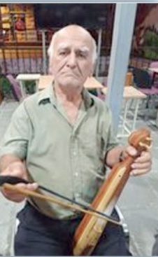
Απρίλις έστ'ια και περ'ά τ' άλλο κλαίει τ' άλλο γελά.

Λαζερή (παμποντιακό) Έρθεη κι ορέσ'η η Λαζερή, τον κομκαρ'ν εβ'χάιτεν, φρετινόν κόκκινου οβ'νεν ζ'αν ε' σηε εκ'όναν β'άλτεν. Χριστός Ανέστη οσημερ'ν, όλ' Λάσκονε χαρεμένεα, ο' όλια τ' οσπίτια τρώε' και τ'αί', τα πάρ'τα ανοιγμένεα. Έρθεη ανόσ'α μ' η Λαζερή, τα καλά τα ημέρας, θε φορον'ν και σκεπ'όνασαν τα κορτσότα τ'η χ'ώρας.