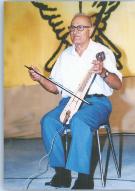
Ο Μάρτζις γέρ' τα χελιδόνια, κεληρθέν και λίν' τα χιόνια

Στις 23 Απριλίου 2019 έφυγε ήσυχα, όπως πέρασε ήσυχα όλη τη ζωή του, για την αιωνιότητα.